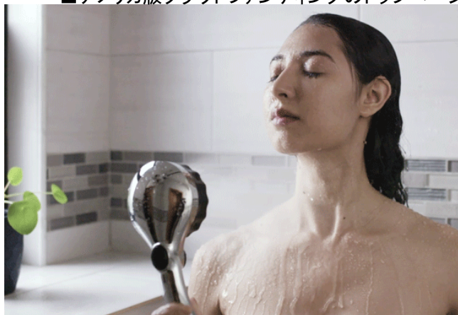
■アメリカ版 PV の一場面