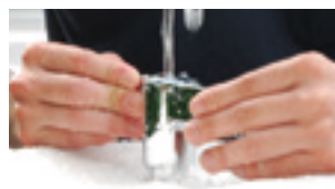
両手でつかんで操作