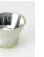
OUKA 桜花 Pink