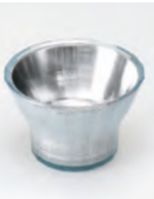
AOZORA 青空 Blue

Pure Copper coated with special kind of plastic which has high antibacterial and thermal effect. Enjoy with Sake, Tea, Coffee etc. There are 4 colors to choose from.