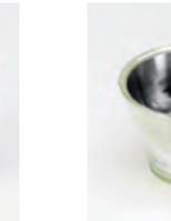
WAKABA 若葉 Green