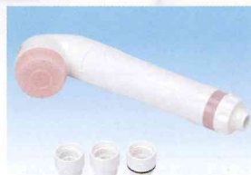
スキンビューティⅢ (ピンク) HV-206SB-P