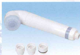
スキンビューティⅢ (ブルー) HV-206SB-B