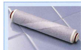
スキンビューティⅢ 交換用カートリッジ HV-206SB-K