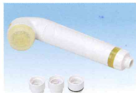
スキンビューティⅢ (イエロー) HV-206SB-Y